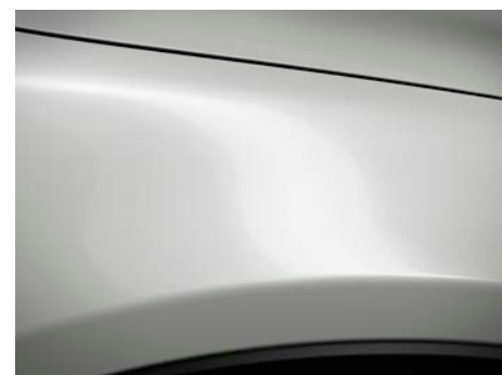
Snowflake bijela (25D) *