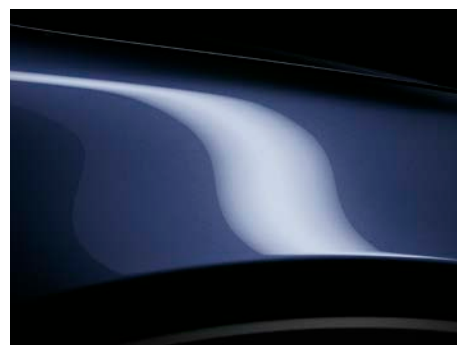
Deep Crystal plava (42M) *