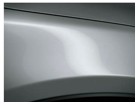
Sonic srebrna (45P) *