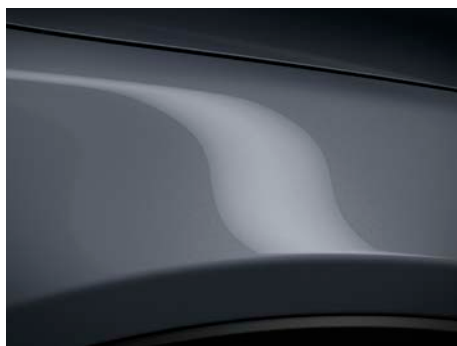
Polymetal siva (47C) *