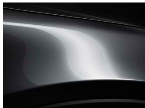
Machine siva (46G) *