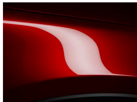
Soul crvena Crystal (46V) *