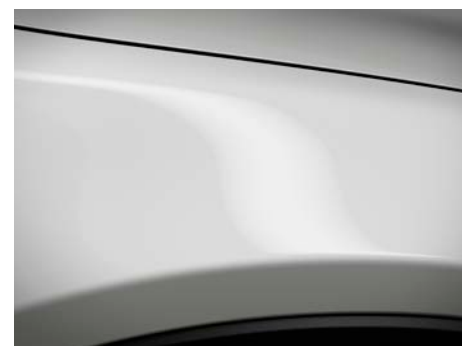
Arctic bijela (A4D)