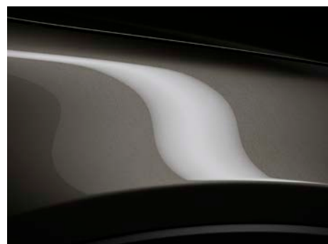
Titanium Flash (42S) *