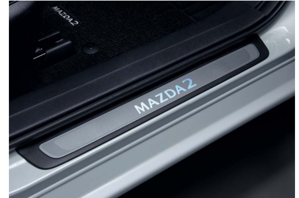
Osvijetljene obloge pragova